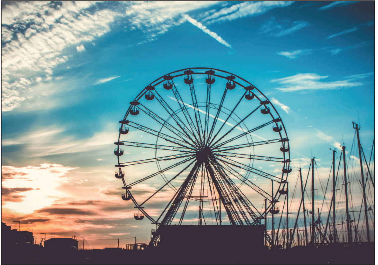
ARTE (#24) - www.oiler.education